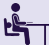
TABLE & CHAISE